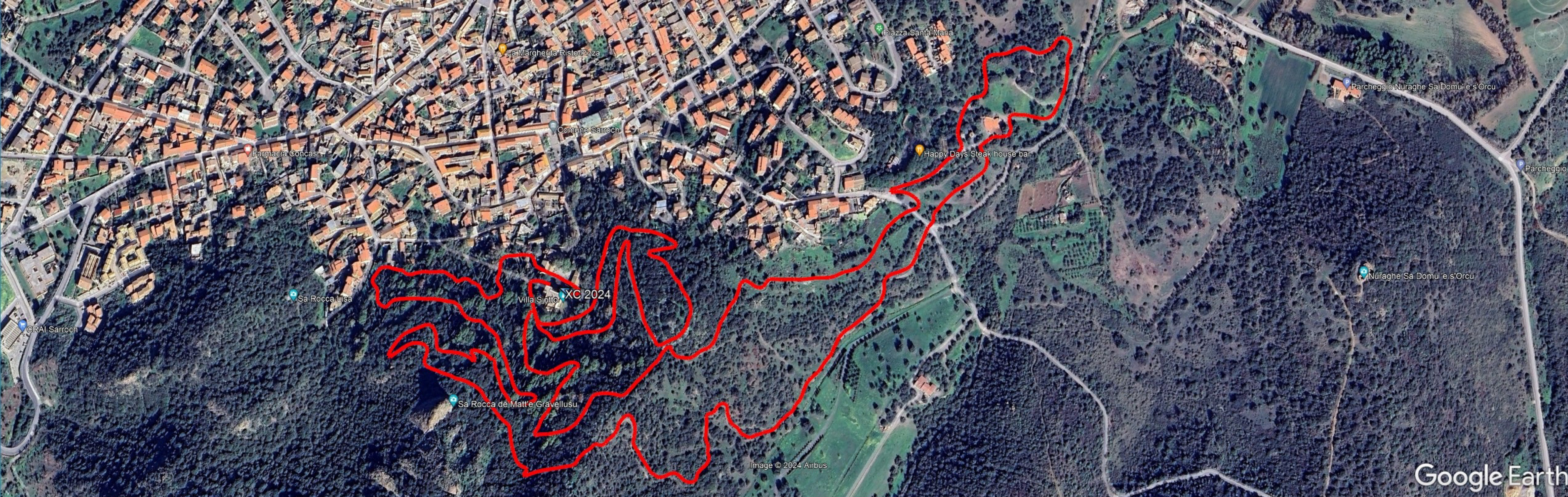
Grafico: min. med. max Elevazione: 31, 72, 120 m Velocità: 4.7, 11.0, 36.0 km/h Heart Rate: 93.0, 127, 150 Temperature: 23, 24.4, 26 Totale intervallo: Distanza: 4.71 km Guadagno/perdita in elev.: 246 m, -245 m Pendenza max: 37.6%, -37.3% Pendio medio: 8.8%, -10.1% Tempo: 25 m 45.0 s